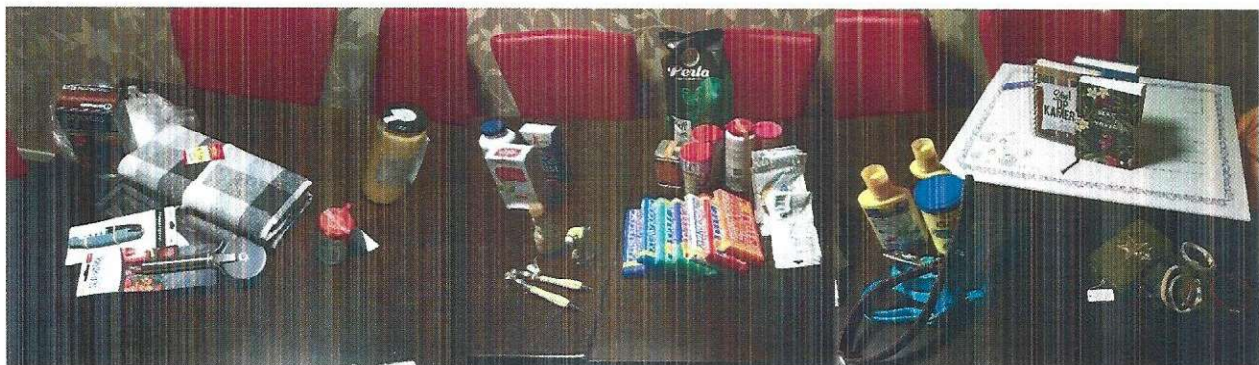
Opbrengst van de Secret Scan actie

De stichting heeft diverse bijeenkomsten voor de ondernemers binnen het winkelgebied georganiseerd, onder andere een workshop in de week van de veiligheid: De 'Secret Scan'. Hierbij is een mysterieshopper met verborgen camera langs de ondernemers gegaan om hen bewust te maken van hoe makkelijk een winkeldief te werk kan gaan. Tevens zijn er preventietips gegeven.